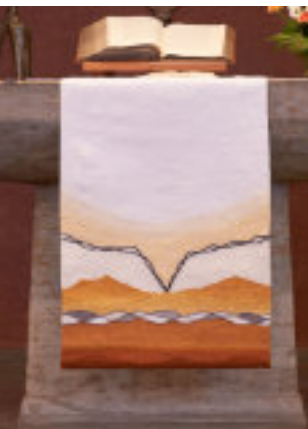
Antependien – Die Farbe Weiß