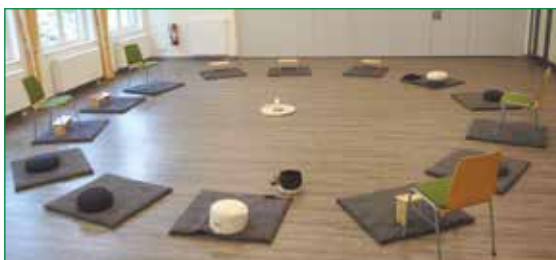
St. Josef Saal im Kath. Gemeindeheim Kupferdreh